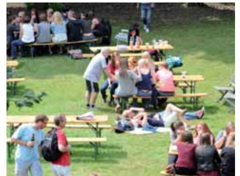
„Sommerfest-Atmosphäre pur“ im Tridelta-Park! Jeder bringt sein Sitzmöbel, sein Grillgut und etwas Leckeres fürs Sommer-Büffet mit!