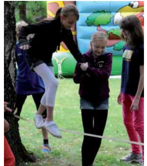
„Slackline-Akrobatik“ für alle zwischen den großen Birken! Natürlich darf auch die „Rodeo-Ente“ nicht fehlen!

Eine ganz große Nummer dabei ist sicher das „ASC 09 Handball-Sommerfest“ am 1. Juli im Tridelta-Park. Bei unserem traditionellen ASC 09-Familienfest darf einfach niemand fehlen, denn neben richtig viel Sommerflair, ganz viel Musik, bunten Spielen und leckerer Grill-Gastronomie mit unserem riesigen Mitbring-Buffer erwartet den blauweißen Anhang die unterhaltsame Präsentation unserer neuen Trainer, Aktiven, Trikots und Förderer. Der Kuhbar-Eisbecher ist wieder da! Die Herren-Mannschaften betreiben den Getränkewagen und laden euch ein zum Wikingerschach. Und unsere Damen-Teams erwarten euch beim Gesichter-Schminken, an der Rodeo-Ente und bei der Broom-Hai-Attacke. Das „ASC 09 Handball-Sommerfest“: Einen Samstag lang das volle ASC 09-Programm und der volle Spaß! Freut euch drauf! Ihr alle seid herzlich willkommen!