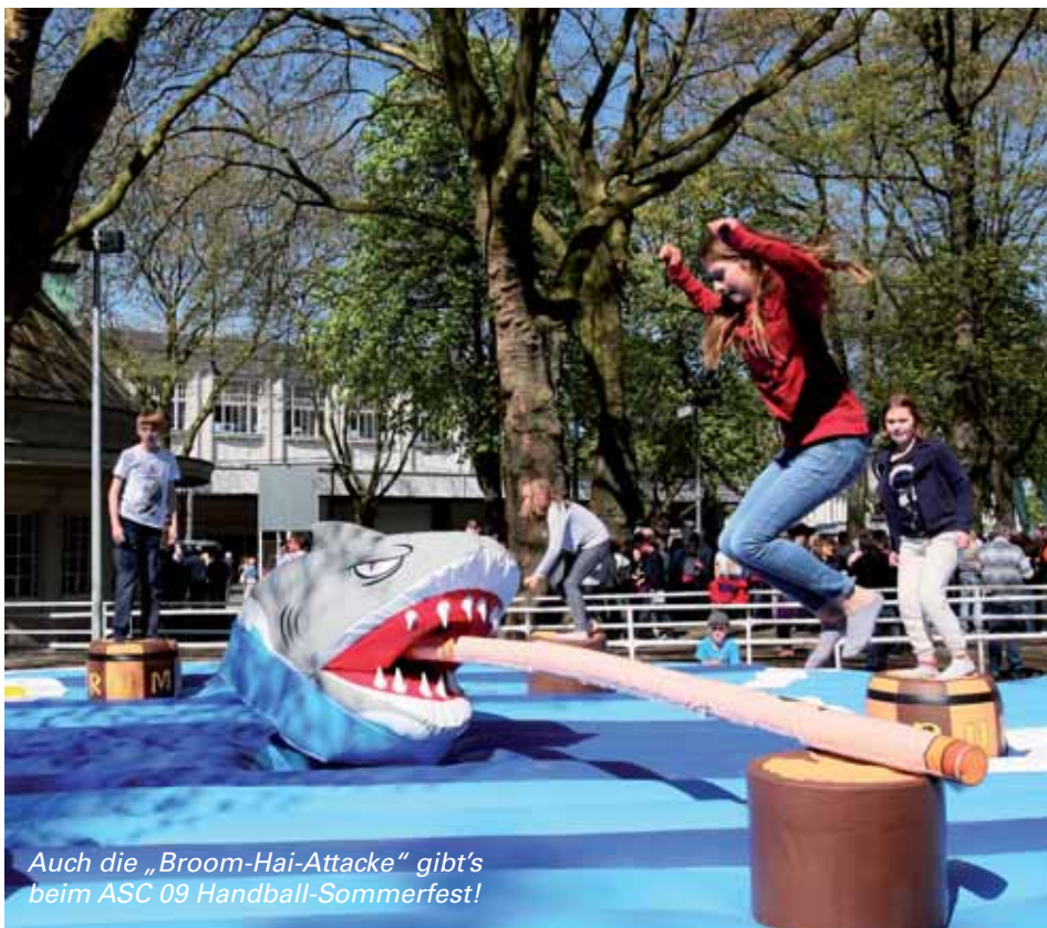
Auch die „Broom-Hai-Attacke“ gibt's beim ASC 09 Handball-Sommerfest!