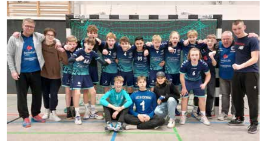
oben: Die männliche C1-Jugend beendete die Oberliga-Saison 2022-23 als bestes Team aus dem Kreis Dortmund.

Großen Spaß haben der Handballabteilung auch die anderen C-Jugend-Mannschaften bereitet. Sowohl die weibliche als auch die männliche C1 hatten sich vor der Saison nicht nur für die Oberliga qualifiziert, sondern auch die Endrunde erreicht. Dort verpasste die wC mit 10:10 Punkten als Vierter nur um zwei Zähler die Vizemeisterschaft hinter dem übermächtigen BVB. Die mC behauptete sich als Endrunden-Fünfter mit 4:16 Zählern vor der DJK Ewaldi als bestes Dortmunder Team. Insbesondere Hamm-Westfalen, Menden und Ahlen waren aber eine Nummer zu groß.