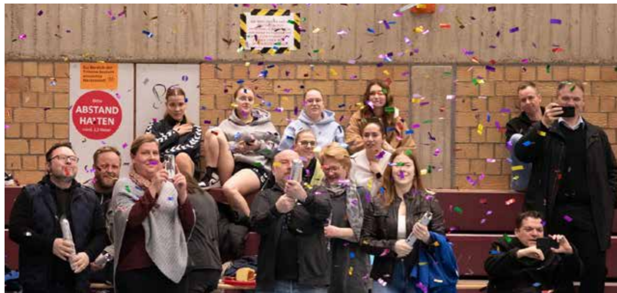
Meister-Jubel. Die Eltern der mC2-Spieler ließen Konfetti-Kanonen knallen.

Eine einzige Niederlage kurz vor Saisonschluss gegen die DJK Saxonia befechtete schließlich die ansonsten blütenweiße Weste. Nach dem 50:22-Rekordsieg im letzten Heimspiel gegen Dorstfeld/Huckarde folgte die Ehrung des Meis-