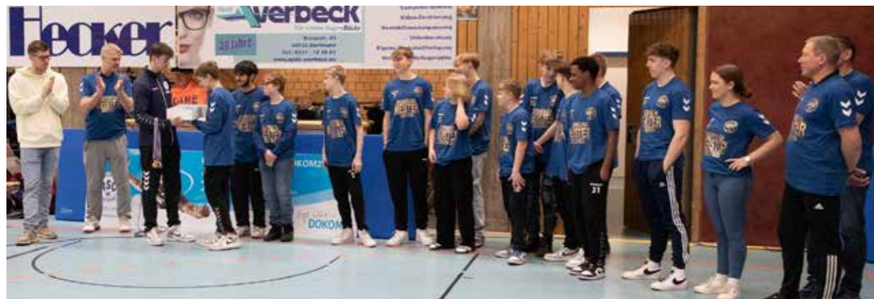
Meisterehrung der mC2. Natürlich gab's auch individuelle Medaillen.

terteams mitsamt Trainern. Die Eltern zündeten Konfetti-Kanonen. Der ASC 09 hatte eine Torte mit Mannschaftsfoto und Medaillen mit Gravur anfertigen lassen. Und die Meister-Shirts sind natürlich ohnehin obligatorisch. Nach den Oster-