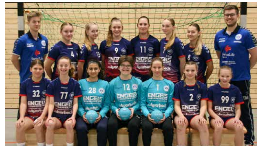
links: Oberliga-Vierte und nur knapp am zweiten Rang hinter dem BVB vorbei. Auch unsere wC-Jugend spielte eine starke Saison 2022-23.