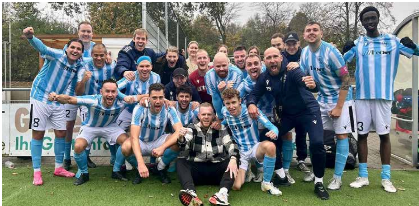
Derby-Sieg der Zweiten in Sölde

Die sportliche Situation der zweiten Mannschaft hat sich seit der letzten Spiegel-Ausgabe im September 2024 deutlich verbessert. Zum Jahreswechsel steht das Team auf Platz 7 (22 Punkte) der Tabelle in der Kreisliga B2 und hat zehn Punkte Abstand zu den Abstiegsplätzen.