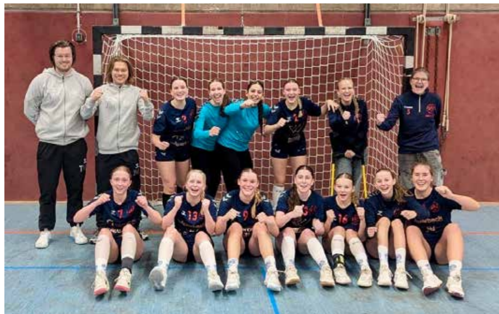
Stadtmeister 2024 - unsere wB-Jugend.

Vier teilnehmende Teams – viermal Edelmetall: Der Handball-Nachwuchs des ASC 09 durfte sich bei den DOKOM21-Stadtmeisterschaften über Gold für die weibliche B-Jugend, Silber für die weibliche A- und die männliche B-Jugend sowie Bronze für die weibliche C-Jugend freuen. Die Bilanz war unter dem Strich okay, wenngleich sich die Teams insgeheim etwas mehr ausgerechnet haben dürften. Klar ist: Die Handball-Abteilung muss in den kommenden Jahren wieder mehr teilnehmende Mannschaften stellen. Mittelfristiges Ziel muss sein, wieder in allen Altersklassen vertreten zu sein.