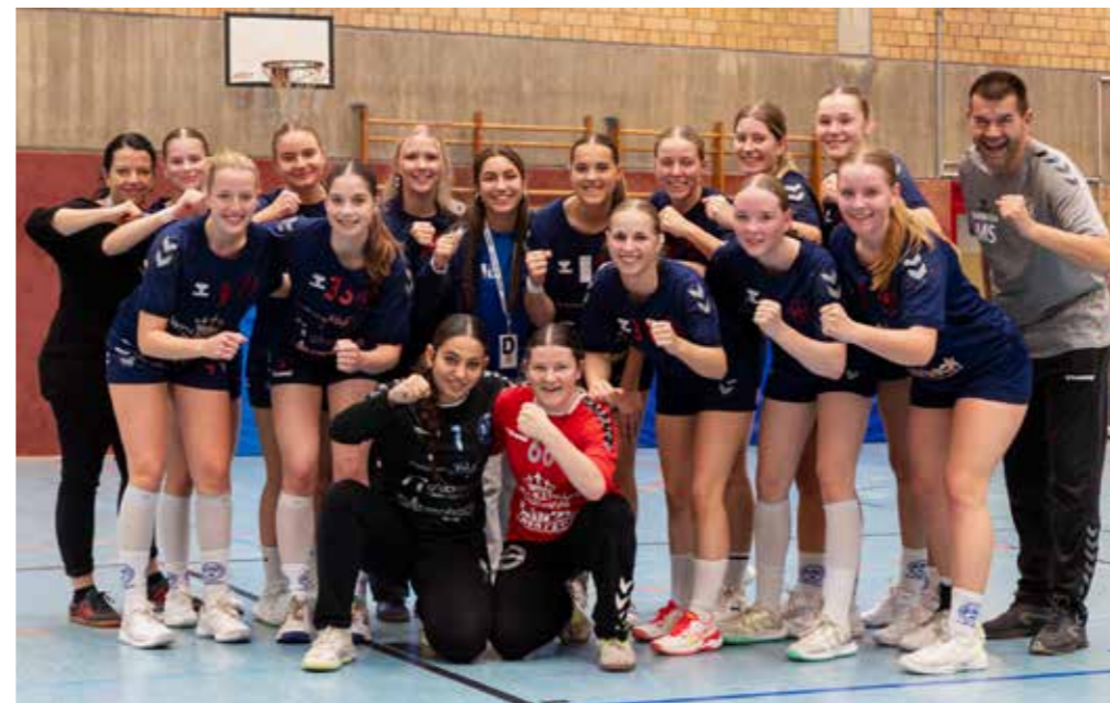
Silber bei der Stadtmeisterschaft - unsere wA-Jugend.