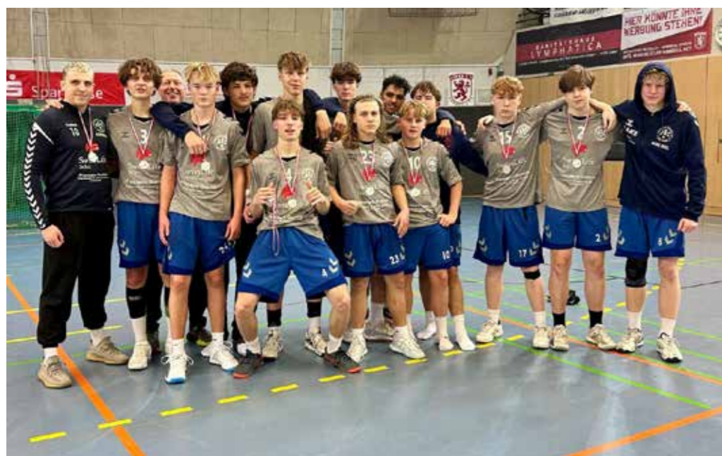
Silber bei der Stadtmeisterschaft - unsere mB-Jugend.