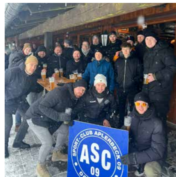
Das Team bei der traditionellen Willingen-Fahrt im Dezember

Die Mannschaft freut sich über jede Aplerbecker Unterstützung bei den Spielen.