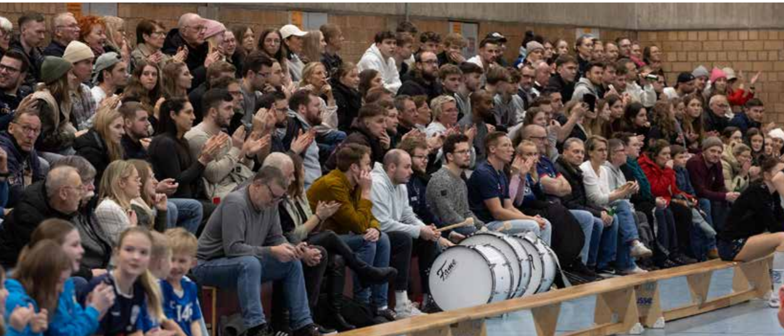
Volles Haus beim Dortmunder Derby. Die Stimmung in der Sporthalle Aplerbeck 1 war prächtig.

Als unsere Handball-Damen am 13. Dezember den Tabellenführer und Lokalrivalen Borussia Dortmund 2 zum Spitzenspiel der Regionalliga empfangen, sprach sehr viel FÜR einen Sieg der Schwarzgelben. Nach wenigen Minuten sprach dann auch noch sehr viel GEGEN einen Sieg der Aplerbeckerinnen. Doch dann kam alles ganz anders – und die Zuschauer in der rappelvollen Sporthalle Aplerbeck 1 erlebten eine Sternstunde des ASC 09.