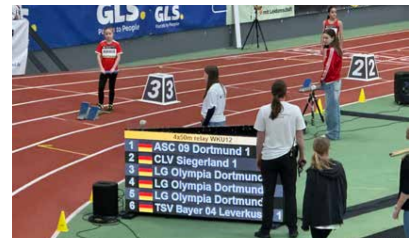
In bester Gesellschaft. Bayer Leverkusen . . . die LGO . . . und der ASC 09.