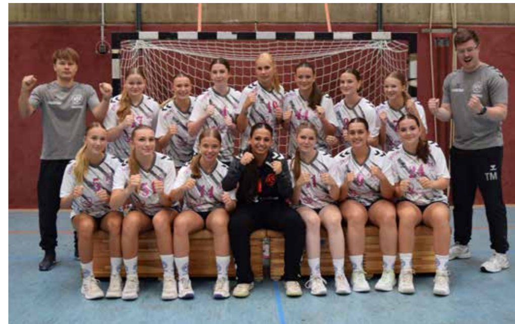
Stadtmeister und Oberliga-Vizemeister. Die weibliche B-Jugend spielte eine tolle Saison 2025-26.