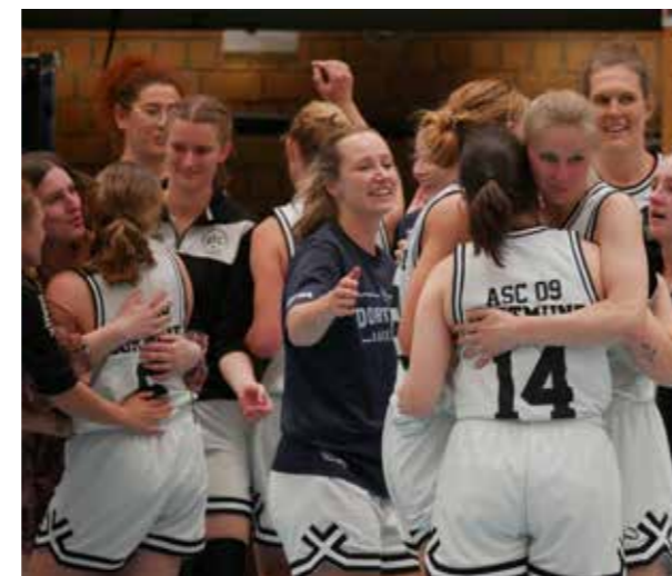
Damen 1 Jubel gegen Werne

Ende April kam es auf das letzte Spiel an – und das hat es in sich. Die LippeBaskets Werne und unsere Damen kämpften darum, von dem drittletzten Platz wegzukommen. Denn: Dieser könnte eventuell auch ein Abstiegsplatz sein. Es ging darum, wer zittern muss und, wer sich entspannt auf die nächste Oberliga-Saison vorbereiten kann. Unsere Damen bewiesen Nervenstärke, drehten den 28:38-Rückstand nach zwei Vierteln zu einem 75:56-Ausrufezeichen und dürfen nächste Saison wieder in der Oberliga starten.