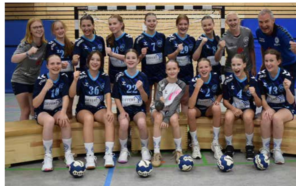
Mit Platz drei in der Bezirksliga lieferte die weibliche C-Jugend eine Klasse-Leistung ab.