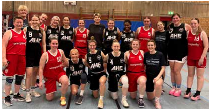
Damen 2 gegen Wickede