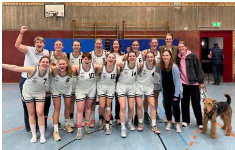
Damen 1 gegen Eintracht

Unsere Damen 2 haben im März ein echtes Ausrufezeichen gesetzt. Mit drei Siegen in Folge gegen Hagen (64:54), Barop (53:20) und Wickede (56:38) spielte sich das Team eindrucksvoll in die obere Tabellenhälfte der Bezirksliga 6. Mit nun sieben Siegen bei sechs Niederlagen steht ein verdienter vierter Platz zu Buche. Das Derby bei Eintracht Dortmund stand vor Redaktionsschluss noch aus.