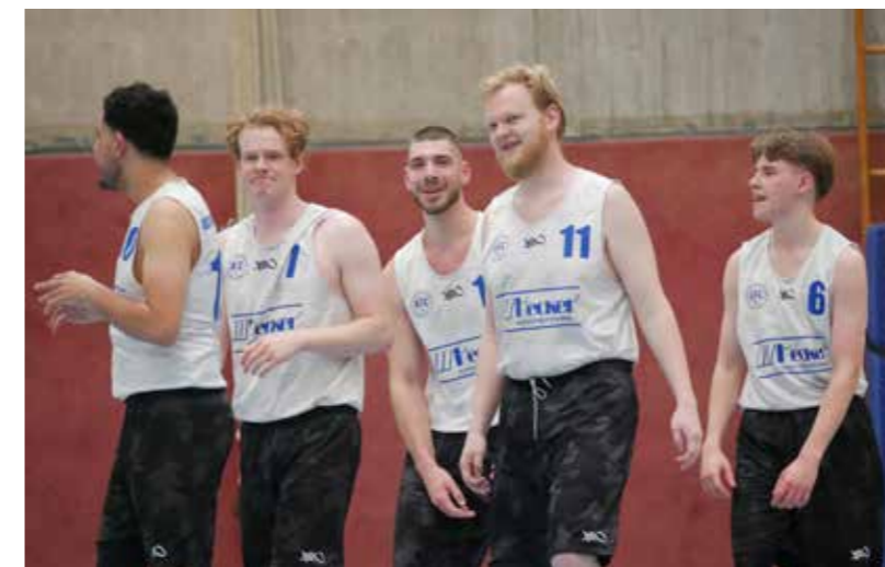
Trotzdem mit Spass dabei - Herren1