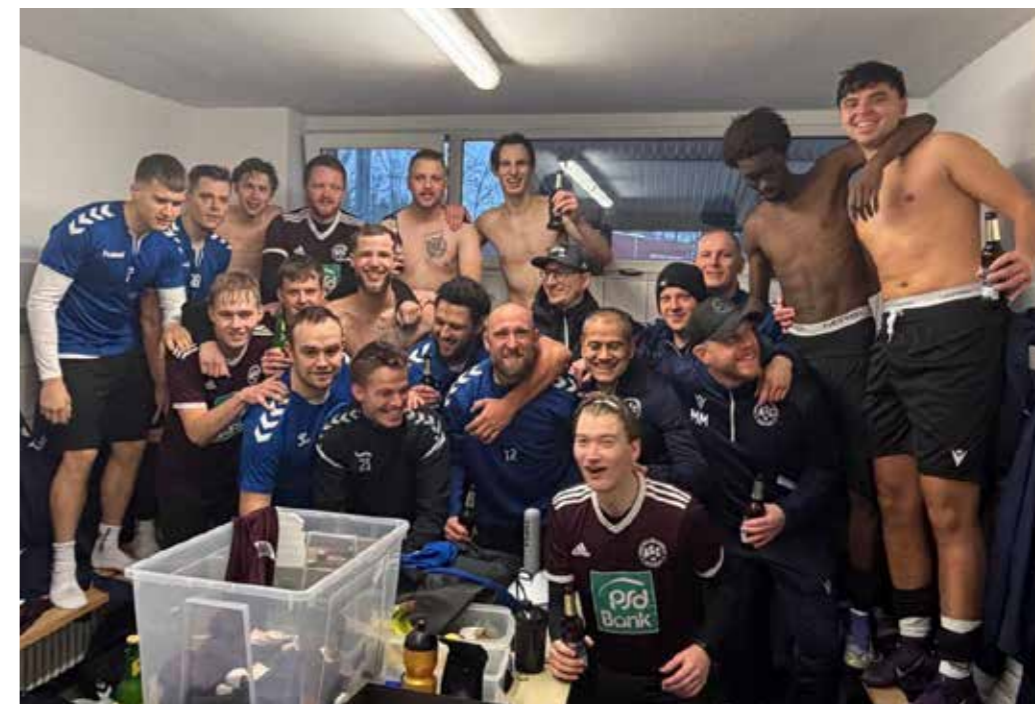
Die Zweite jubelt nach dem Heimsieg gegen den Hörder SC II in der Kabine.

Wie der Name schon verrät, soll mit dem neuen Turnier-Format besonders den Zweitvertretungen der Stadt eine Bühne gegeben werden. Acht Teams spielen um den Turniersieg, dazu gibt es gute Musik, frisches Bier vom Fass, Wein, Aperol und Leckerer vom Grill.