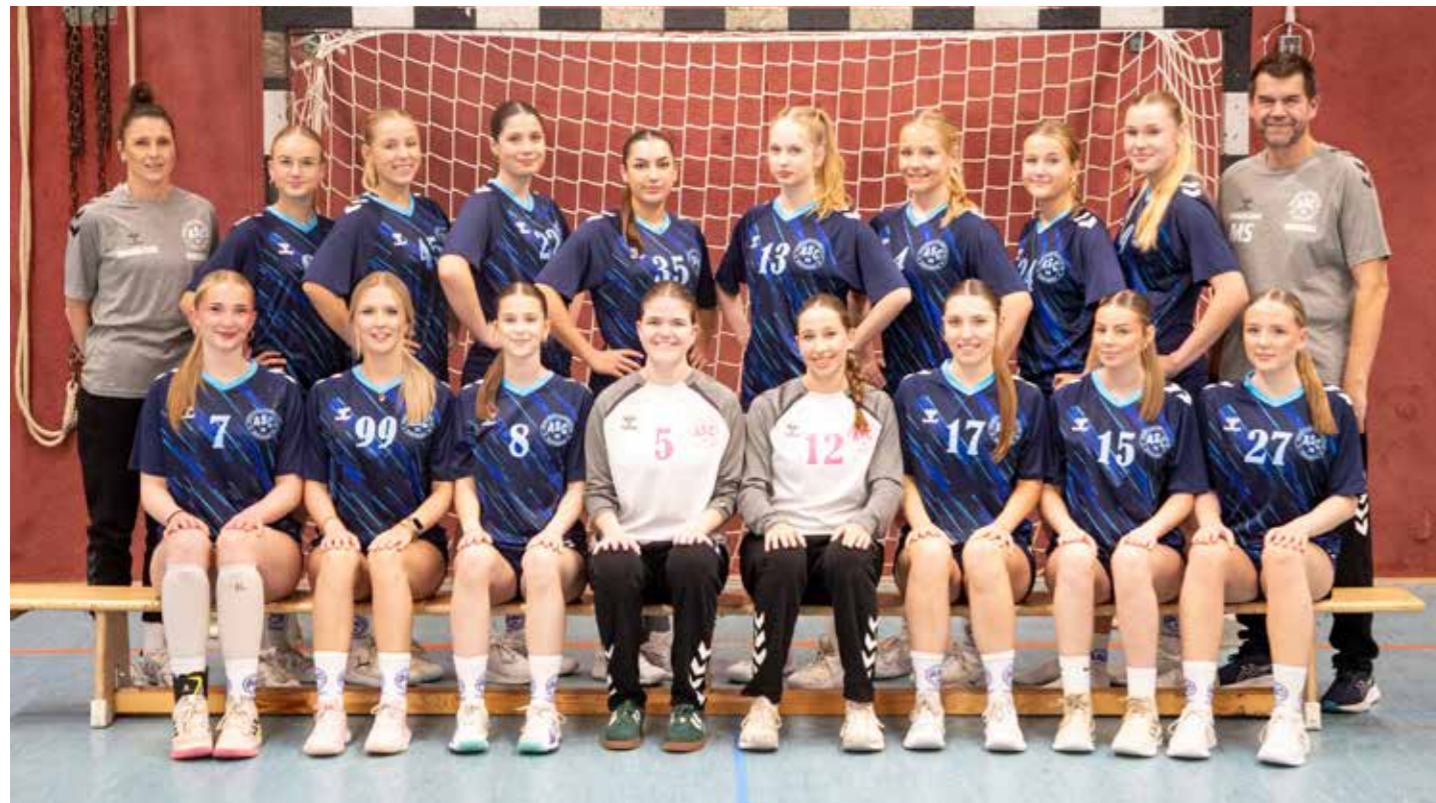
Stadtmeister und Oberliga-Meister. Die weibliche A-Jugend gewann 2025-26 das Double.